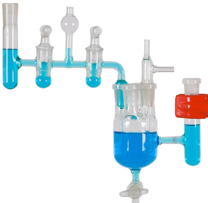
Рис. 1. Внешний вид собранной ячейки SC-1 без электродов и пробок.

Большая часть компонентов ячеек изготовлена из стекла. Все они стандартизованы и при необходимости любой из них можно приобрести дополнительно. Все компоненты (электроды, продувки, мостики и пробки) взаимозаменяемы для обоих типов ячеек. Все соединения выполнены на шлифах 14 калибра. Основная рабочая емкость имеет четыре вертикальных входных шлифа. В них вставляются электролитический ключ, продувка, рабочий электрод. Четвертый шлиф может быть заткнут полимерной пробкой из комплекта поставки или в него может быть установлен вспомогательный электрод. Также, в него может быть установлен сосуд подготовки рабочего раствора, если таковой имеется, или иные компоненты.