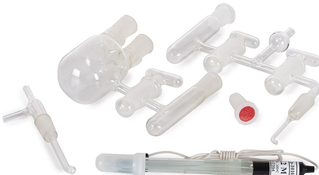
Рис. 2. Внешний вид основных компонентов ячейки SC-2 по отдельности.

Пористое стекло ячейки SC-1, в отличие от крана, создает меньшее падение напряжения, что позволяет использовать приборы с относительно невысоким выходным напряжением в 15 В при достаточных токах. При заполнении ячейки рекомендуется одновременно (или с минимальным по времени интервалом) заполнять основную и вспомогательные емкости. Это особенно актуально в том случае, если они заполняются разными по составу растворами. Дело в том, что пористый разделитель хоть и медленно, но все же пропускает растворы. Поэтому, если уровни растворов по его стороны будут различаться, то произойдет подтекание их из одной емкости в другую, и составы растворов могут поменяться. Например, в рабочей емкости снизится количество введенного для синтеза реагента, в случае если он перетечет во вспомогательную емкость, и снизит выход продукта. В другом случае, если фоновый электролит перетечет в основную емкость, может снизиться концентрация реагента в основном объеме. Если же заливаются одинаковые растворы, эта ситуация не является критичной.